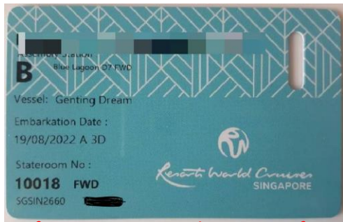
ตัวอย่างการ์ดห้องพัก