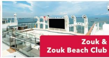
Zouk & Zouk Beach Club