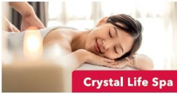
Crystal Life Spa

เรือจะมีแท็กกระเป๋าและกำหนดการลงจากเรือให้ท่านในห้องพักของท่าน ให้ท่านนำกระเป๋าเดินทางของท่านวางไว้หน้าห้องเพื่อให้พนักงานนำลงไปที่ท่าเรือในวันรุ่งขึ้น(สิ่งของที่ท่านจำเป็นต้องใช้ระหว่างวันให้ท่านแยกใส่ในกระเป๋าถือ )