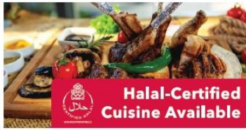
Halal-Certified Cuisine Available