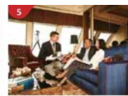
The Palace Indulge in European-style butler service and exclusive facilities.