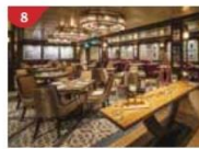
Bistro By Mark Best Relish contemporary Western cuisine from the internationally-acclaimed Australian chef.