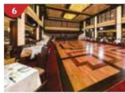
Dream Dining Room Savour a wide variety of Asian and international cuisine.