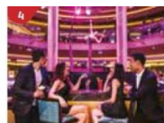
Bar 360 Catch live music and aerial acrobatic performances with a glass of champagne.